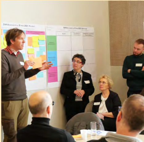
Conseil National de la Refondation (CNR) sur le territoire des Coëvrons