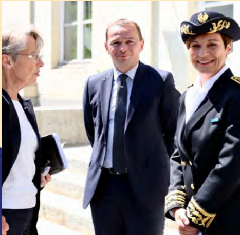
Visite de la première ministre Élisabeth Borne pour le lancement de France Travail en Pays de la Loire