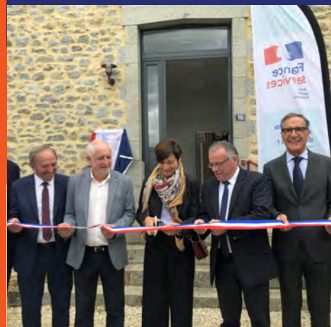
Inauguration de la maison France Services d'Andouillé