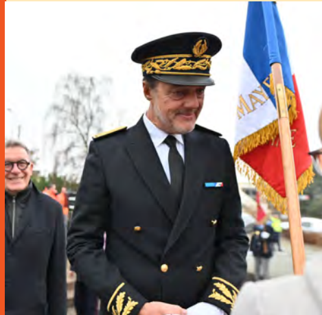
Prise de fonction d'Arnaud Benoît, sous-préfet de Mayenne