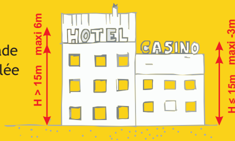
Exemple d'une commune de moins de 10 000 habitants

Sur les immeubles plus grands, la hauteur est limitée au 1/5ème de la hauteur de la façade dans la limite de 6 mètres. La superficie cumulée des enseignes ne peut dépasser 60 m 2 .